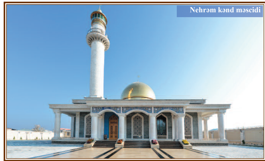
Nehrəm kənd məscidi

“Naxçıvan abidələri ensiklopediyası”nda qeyd olunur ki, Vənəndin mərkəzi meydanında yerləşən və