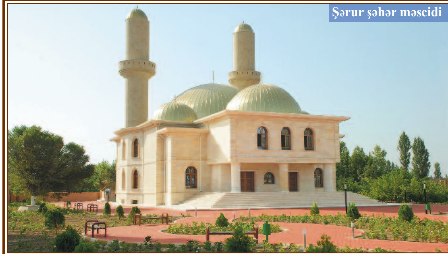
Şərur şəhər məscidi

bədən ibarət olan bu məsciddə 1987-ci ildə təmir işləri aparılıb. Tikilinin yerdən tavana qədər hündürlüyü 9, yerdən günbəzədək hündürlüyü isə 15 metrdir. Birinci mərtəbə kişilər, ikinci mərtəbə isə qadınlar üçün nəzərdə tutulub. Bu ibadət ocağı kəndin ən uca bir nöqtəsində yerləşən öz memarlıq quruluşu ilə gözoxşayan ibadət yeridir. Bənəniyar kənd məscidi tarixi abidə kimi də mühüm əhəmiyyətə malikdir.